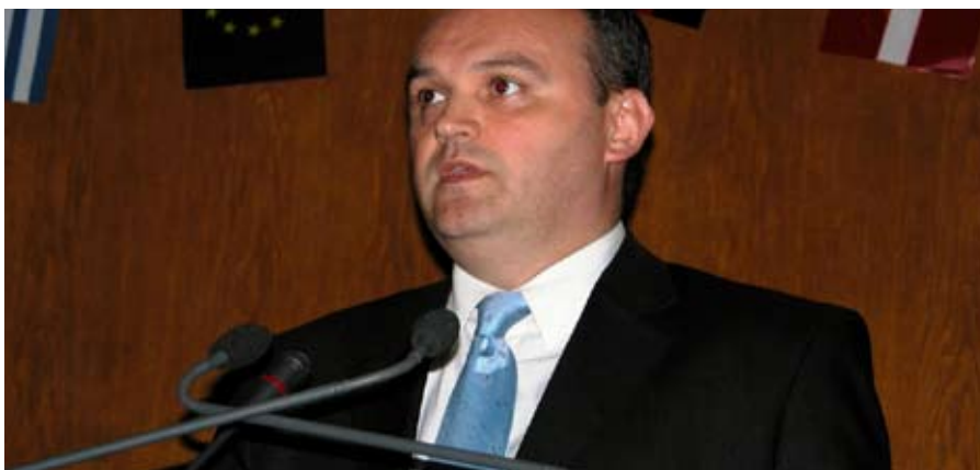
Ovidiu Ganc, član Evropskog parlamenta otvara EU-simulaciju // MdEP Ovidiu Ganč eröfnet die EU-Simulation

Dušan Vojnović je u simulaciji imao ulogu predstavnika novih članica Evropske Unije. Kao Vaclav Klaus zastupao je češku stranku ODS u Frakciji ENP u Evropskom parlamentu. Za Dušana je bila velika čast da dostojno zastupa jedno takvo ime. Da bi što bolje odigrao svoju ulogu Dušan je istraživao na internetu i u časopisima, čitao razne intervjuve sa njim. Za vreme simulacije u parlamentu bio je odabran da iznese stavove Evropskog parlamenta pred Komisijom. «Rezolucija, koju smo izgradili, bila je rezultat pregovora i dobre saradnje svih učesnika», kaže Dušan. Želja mu je da se jednom lično upozna sa Vaclavom Klausom i postavi mu nekoliko pitanja o