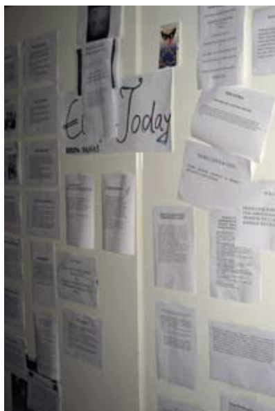
Dole: Aktualnosti sa zidnih novina su svima bile na raspolaganju

Ein Team aus zwölf Jugendlichen spielte bei der Simulation die internationale Presse und achtete auf jedes Wort der Delegierten.