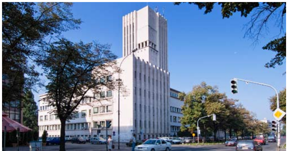
Das Regierungsgebäude der Autonomen Provinz Vojvodina in Novi Sad. // Zgrada Izvršnog veća Autonome Pokrajine Vojvodine.

Als Hauptstadt der Autonomen Provinz Vojvodina haben hier der Exekutive Rat und das Parlament der AP Vojvodina ihren Sitz. Das Gebäude ist der ehemalige Sitz der Donaubanschaft und der Bannschaffsverwaltung. Es wurde zwischen 1935 und 1940 errichtet und zählt zu den schönsten Bauwerken des 20. Jahrhunderts im Land.