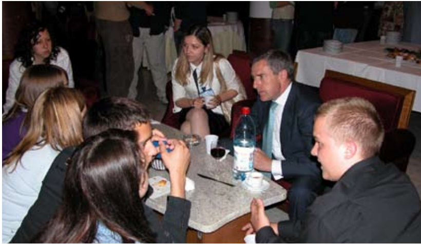
Jugendliche und Experten im Gespräch: junge Delegierte und der Botschafter der EU-Mission in Belgrad, Josep Lloveras. // Mladi i eksperti u razgovoru: mladi delegati i ambasador Žozep Lloveras, šef delegacije Evropske komisije u Beogradu.