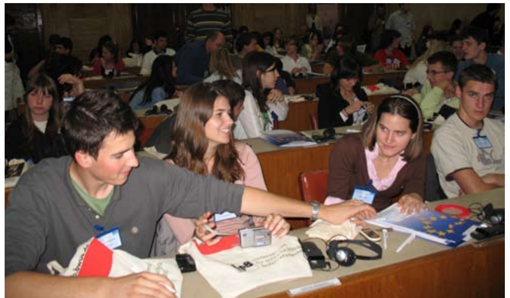
Internationales Arbeiten unter Jugendlichen: Delegierte des EU-Jugendparlaments. // Međunarodna saradnja mladih: delegati Evropskog parlamenta mladih.

Mladi poslanici su od 10 h u subotu, na dan simulacije, raspravljali u nekoliko prostorija. Najpre su pojedine institucije formulisale svoj stav, a zatim su se učesnici na konferenciji za novinare suočili sa predstavnicima medija. Nakon ručka su mladi poslanici zemalja kandidata morali da predstavne svoju zemlju i izraze želju za članstvom. Na drugoj radnoj sednici je morala biti doneta odluka o zahtevu Hrvatske i Turske za članstvom. Na konferenciji za novinare su institucije javno iznele svoju odluku: „Sa obe zemlje će biti započeti pregovori.“ Oko 16 h je kucnuo važan čas za srpsku delegaciju, u kojoj se nalazila i jedna učesnica iz Hrvatske. Ona je morala da ubedi ostale države, da sa „njenom“ zemljom započnu pregovore o potpisivanju Sporazuma o stabilizaciji i