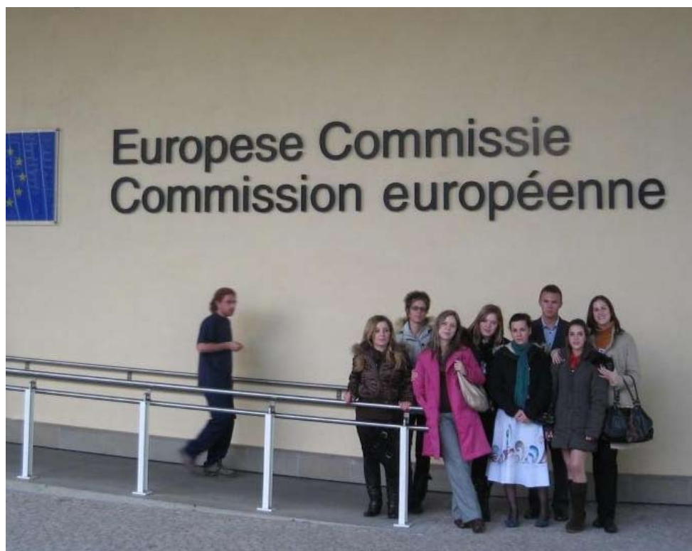
Delegierte des EU-Jugendparlamentes vor dem Gebäude der Europäischen Kommission. // Delegacija Evropskog parlamenta mladih ispred zgrade Evropske komisije.

Im geradezu perfekt organisierten Programm fand die Gruppe auch Zeit für kulturelle Besuche wie die Da-Vinci-Ausstellung, was die Jugendlichen sehr genossen. Einziger Wermutstropfen: Die Jugendlichen hatten den Politikern leider keine Nachrichten vom EU-Jugendparlament mitgebracht. Aber das wird nachgeholt.